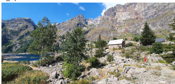
◁ Lac du Lauvitel avec le chalet servant de laboratoire et de lieu d'accueil des scientifiques