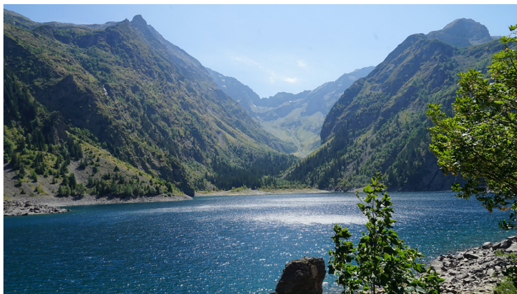
△ Lac du Lauvitel et réserve intégrale

Randonnée qui nous mène vers le lac du Lauvitel plus grand lac du massif des Écrins, au cœur du parc national. Montée en rive droite (500 m de dénivelé) et descente en rive gauche. Après quelques explications sur la formation géomorphologique de ce lac, présentation de la réserve intégrale et visite du chalet de la réserve base d'accueil des missions scientifiques. Présentation des axes du plan de gestion de la réserve et du concept de réserve intégrale. Visite de la station météorologique associée.