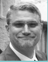
Président de l'APBG