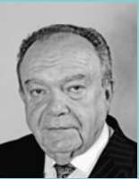
Coordinateur des journées