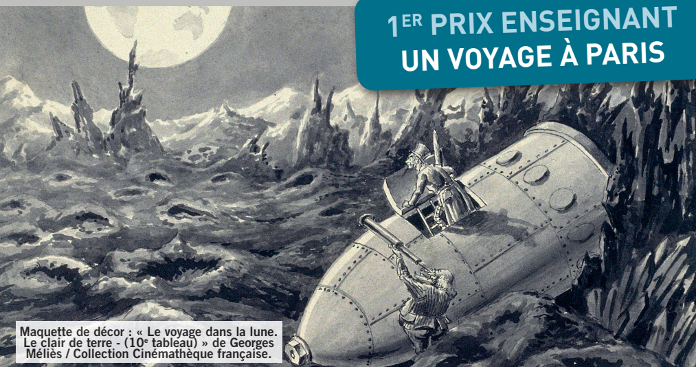
Maquette de décor : « Le voyage dans la lune. Le clair de terre - (10 e tableau) » de Georges Méliès / Collection Cinéma-thèque française.

« Et lorsque tout sera aplani, l'impossible enfin sur Terre, la lune dans mes mains, alors, peut-être, moi-même, je serai transformé et le monde avec moi, alors enfin les hommes ne mourront pas et ils seront heureux. »